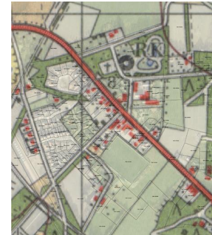
Langeveen in 1900