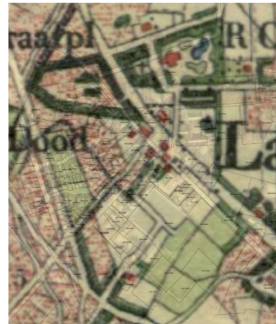
Langeveen in 1960

Langeveen krijgt in 1843 een waterstaatskerkje met pastorie onder één dak. De katholieken uit Striepe (net over de grens in Duitsland) maken ook gebruik van deze kapel, waar een kapelaan uit Geesteren voorgaat in de erediensten. De Striepenaren horen weliswaar bij de parochie van Neuenhaus, maar Langeveen is een stuk dichterbij. In 1851 wordt het dorp een zelfstandige parochie, door afscheiding van de parochie van Geesteren. In 1853 is het kerkje vergroot en in 1925 afgebroken en vervangen door de huidige RK St. Pancratiuskerk, die tegenwoordig deel uitmaakt van de regionale H. Pancratiusparochie Tubbergen. Op het kerkhof bevindt zich een houten klokkenstoel en er is een Lourdesgrot aan de Kerklaan. Rondom de kerk stond in 1900 een kleine kern woningen. Op de kaart van 1960 is aan de Hardenbergerweg een uitbreiding van de kern met huizen te zien nabij de St. Pancratiuskerk.